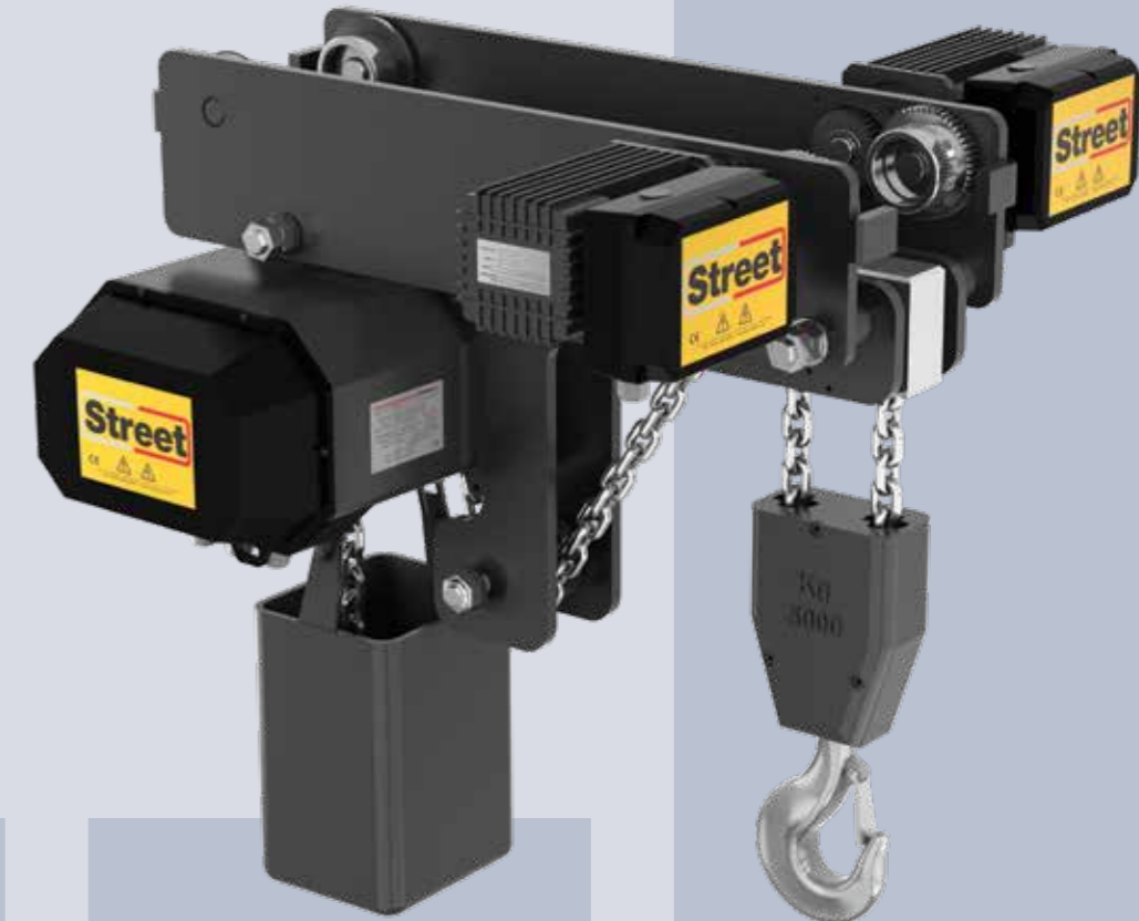
POLIPASTO LX DE BAJA ALTURA Y CARRO ELÉCTRICO