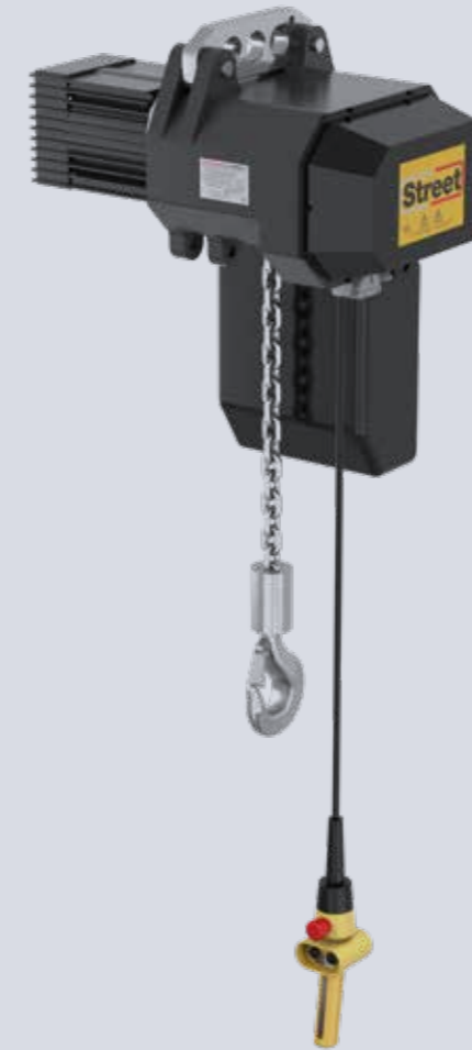
POLIPASTO LX CON SUSPENSIÓN DE CÁNCAMO