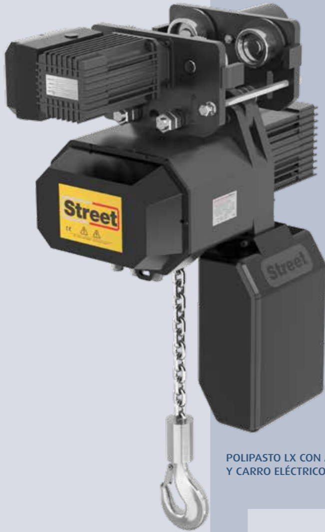
POLIPASTO LX CON ALTURA ESTÁNDAR Y CARRO ELÉCTRICO